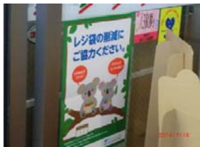
レジ袋削減の取組