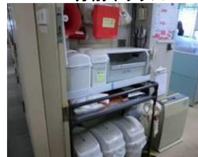
グリーンセンター