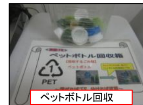
ペットボトル回収