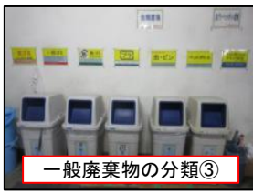
一般廃棄物の分類③