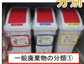
一般廃棄物の分類①