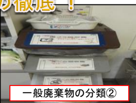
一般廃棄物の分類②