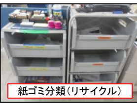
紙ゴミ分類(リサイクル)