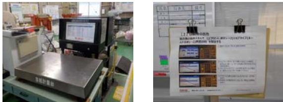
徹底された排出管理