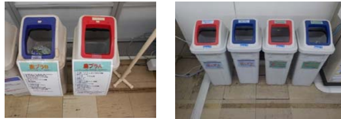
詳細な品目表示で間違い防止