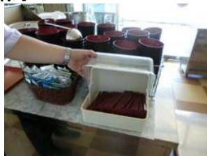
リユースコーナー