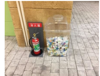
エコキャップ回収ボックス