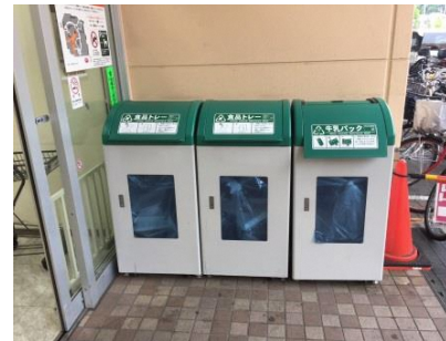
資源回収ボックス