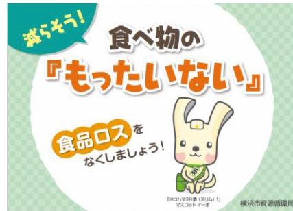
食べきりキャンペーンステッカー