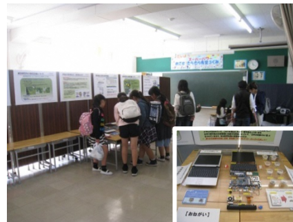
環境出前授業(パソコン分解リサイクルデモ)