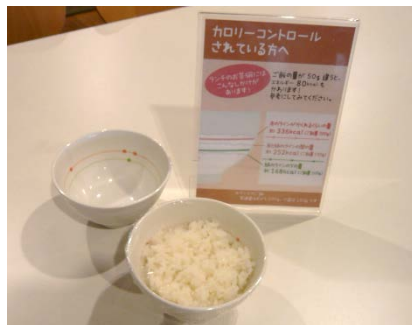
ご飯量の調整(量目安入りの茶碗)