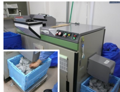
湿式シュレッダー