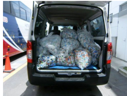
エコキャップの提供