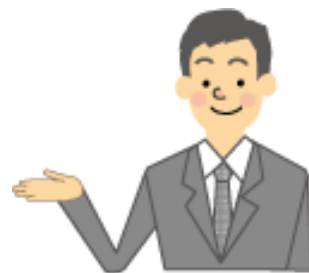
専門家 (社会保険労務士)