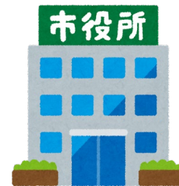
横浜市介護保険課