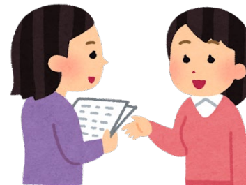
横浜市介護支援専門員協議会