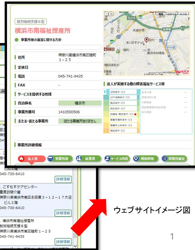
ウェブサイトイメージ図