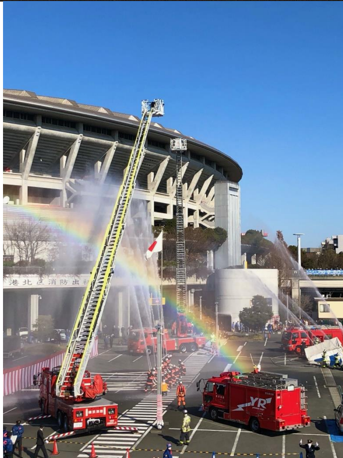
第2回港北消防フォトイベント