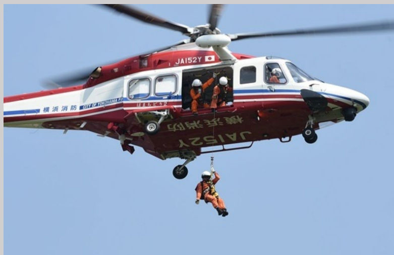
ホイスト救助訓練の様子