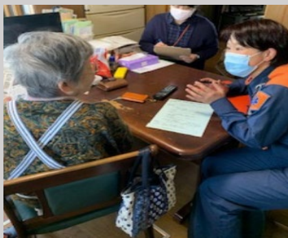
防災訪問の様子

防災訪問をご希望される方は、金沢消防署又は最寄りの消防出張所まで、ご連絡ください。 ☎ 045-781-0119