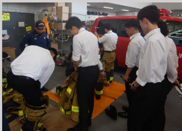
防火服を着装する参加者