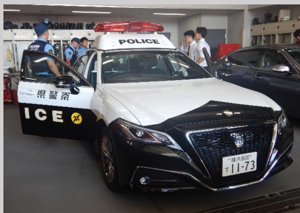
パトカーの説明を受ける参加者

7月23日に金沢警察署と金沢消防署合同の「オープンカンパニー」を開催しました。 金沢警察署と合同で採用イベントを行うのは初めてで、高校生・大学生・専門学生35人が参加し、警察・消防の業務や採用試験について、説明を受けた後、パトカーや消防車などの緊急車両へ乗車したり、防火服着装や、警察の鑑識などの体験を行いました。