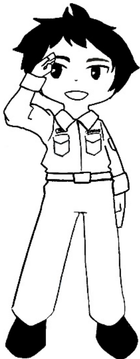
イラスト 金沢高校美術部 MAI 部