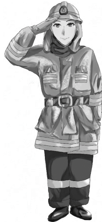
イラスト 金沢高校美術部 MAI 部

【保護者の方へ】 ◎ぬり絵が完成しましたら、金沢消防署予防係（金沢区役所1階）にお持ちください。 ガチャにて景品をプレゼントいたします。 ◎景品プレゼントの受付は平日、9時から17時までです。 土曜、日曜、休日や、平日の17時以降は受付できません。 ◎ご提出いただいた「ぬり絵」と「お名前」「おとし」は、 金沢消防署のデジタルサイネージで上映します。 同意いただけない場合は、下の□に「×」をご記入ください。