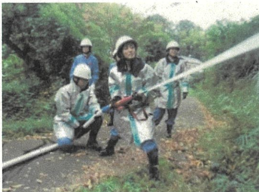
【地域での放水訓練】