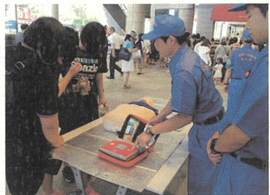
【地域イベントでの応急救護指導】