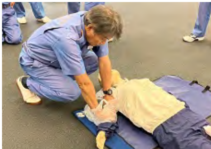
止血法 直接圧迫止血法