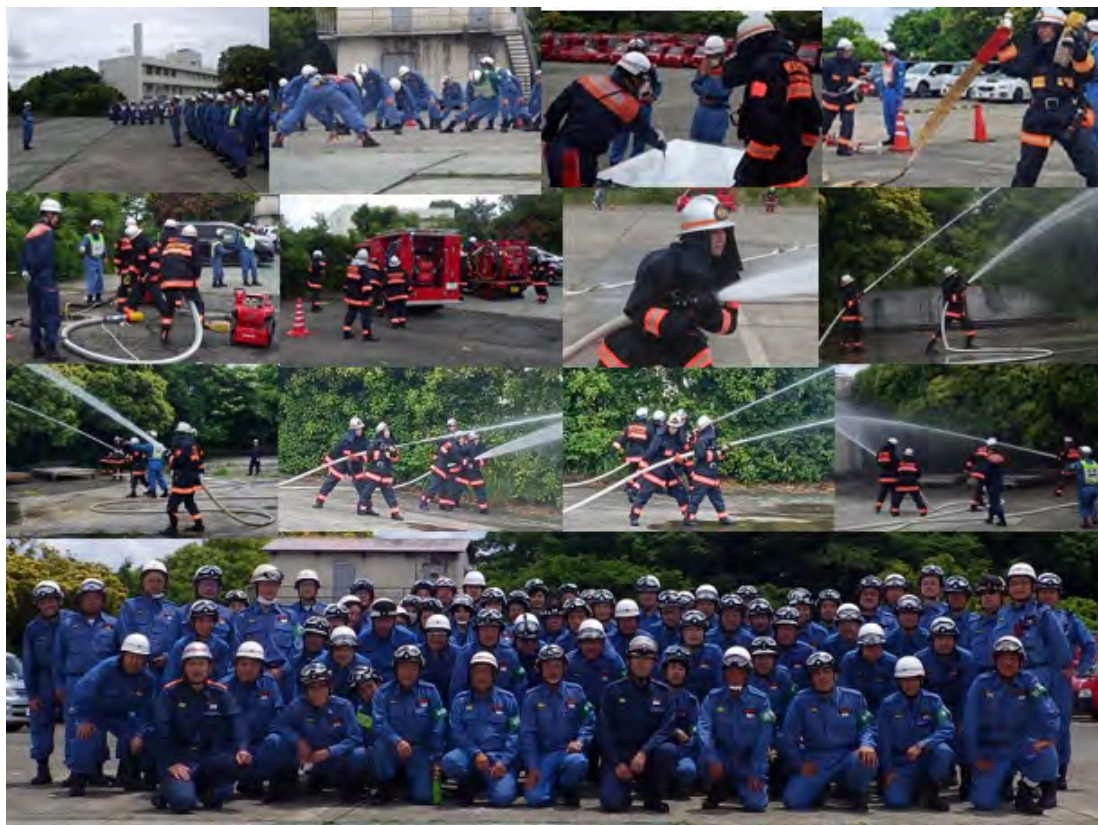
第一分団、第二分団、第五分団