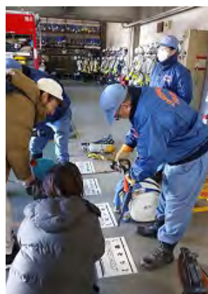
ふれあいブース 資機材展示