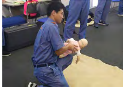
異物除去法 背部叩打法 新生児