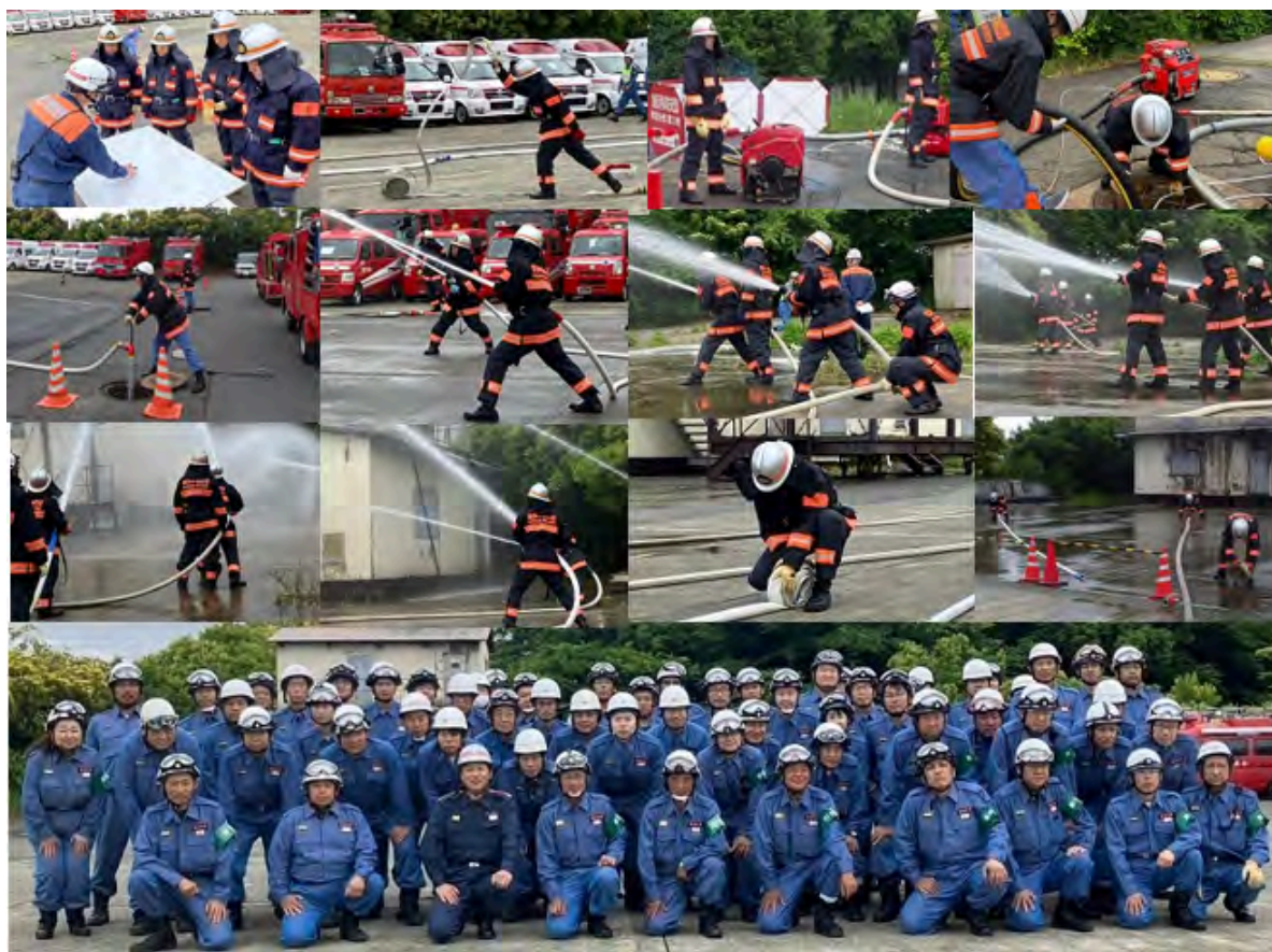
第三分団、第四分団