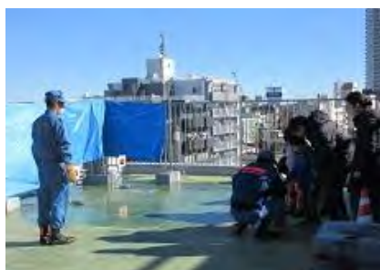
防災啓発ブース 水消火器体験