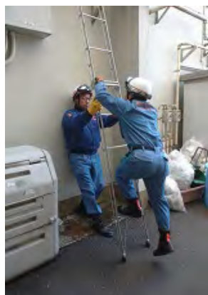
2月16日 二つ折りはしご操作