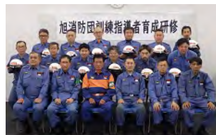
2月16日 認定証交付式集合写真