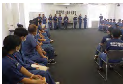
旭消防団上級救命講習 挨拶・講習説明

令和6年8月18日に、上級救命講習を旭区役所新館大会議室で行いました。旭消防団員54名が参加しました。