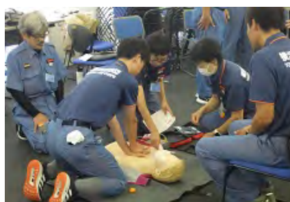
心肺蘇生法 心臓マッサージ