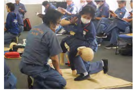
異物除去法 背部叩打法 小児