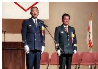
消防団長・消防署長謝辞