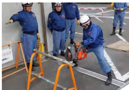
2月16日 エンジンカッター操作