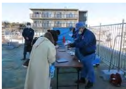
防災啓発ブース 防災クイズ