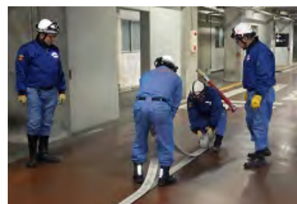
2月9日 ホースの撤収