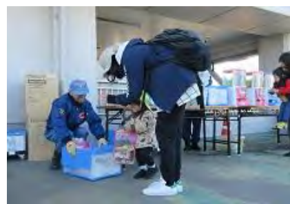
防災啓発ブース 景品配布