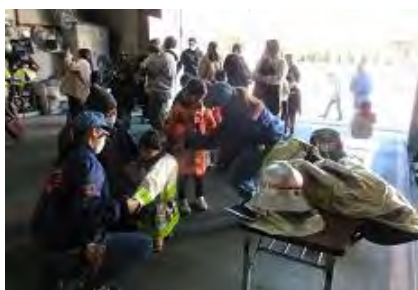
ふれあいブース 防火衣着装体験