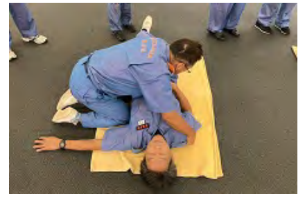
体位管理法 回復体位（側臥位）