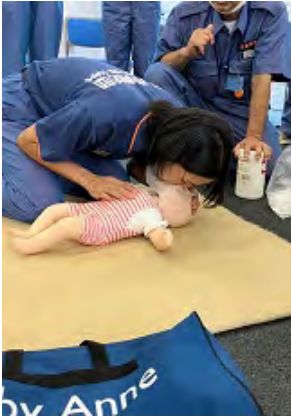
心肺蘇生法 人工呼吸