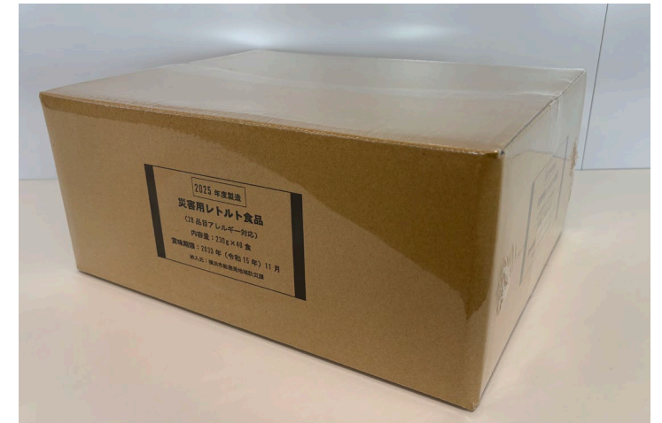
梱包サイズ:400×325×200mm程度 / 重量:約10.5kg

食料配布時には、既存の備蓄品も含め、包装に記載された原材料等の情報を、配布する場所の机に張り出すなどして、受取者が分かるようにしましょう。 中には、特定原材料等28品目以外の食物アレルギーを保有している人もいます。