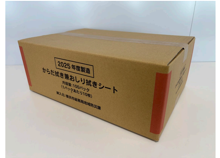
梱包サイズ:310×436×160mm程度 / 重量:約5.5kg

乳幼児に配布する際は、1日のおむつ替えの頻度が個人差や月齢による異なってくることから、避難している乳幼児の人数を踏まえ、必要に応じて配布してください。