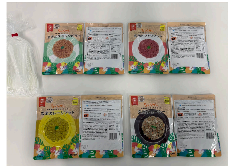
1箱あたり40食入り(4種類×10食)