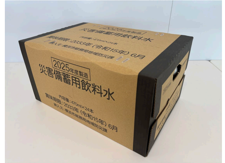
梱包サイズ: 400×270×200mm程度 / 重量: 約12.0kg