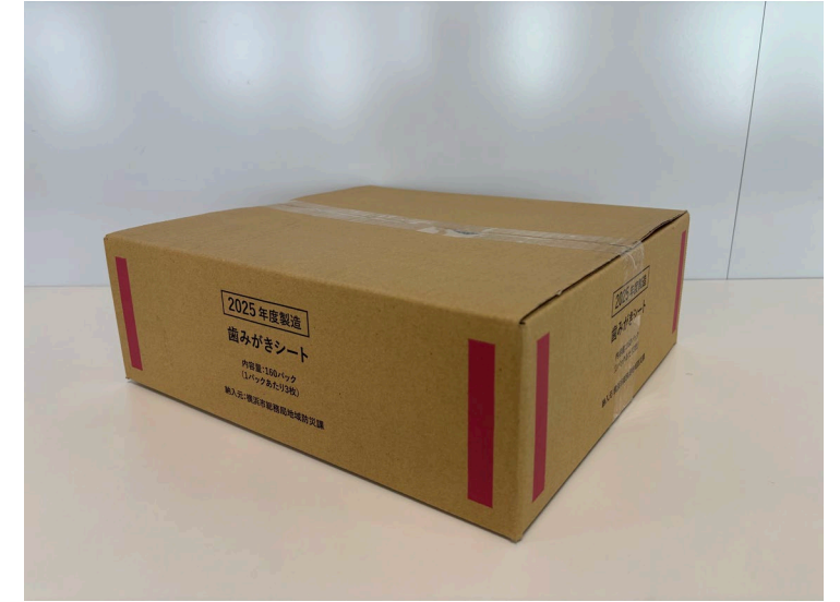
梱包サイズ:380×350×130mm程度 / 重量:約4.0kg