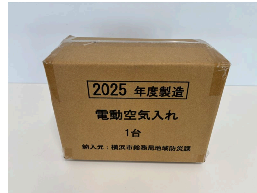
梱包サイズ:300×220×160mm程度 重量 :約2.0kg