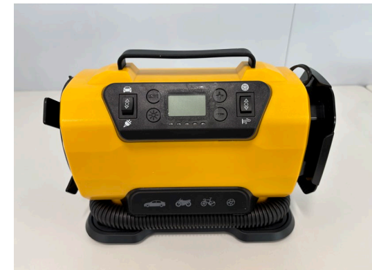
電動空気入れ本体