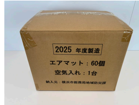
梱包サイズ:450×360×360mm程度 重量 :約19.5kg

さらにエアーマットが不足する場合は、区災害対策本部に必要数量を要望することで、国等からの支援物資を地域防災拠点に供給します。