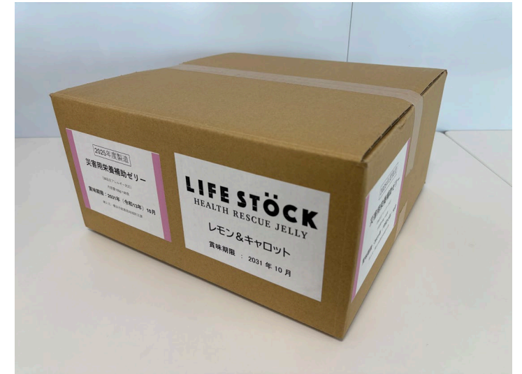
梱包サイズ:352×347×178mm程度 / 重量:約9.5kg

なお食料配布時には、既存の備蓄品も含め、包装に記載された原材料等の情報を、配布する場所の机に張り出すなどして、受取者が分かるようにしましょう。中には、特定原材料等28品目以外の食物アレルギーを保有している人もいます。