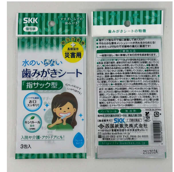
1箱あたり160パック入り / 1パックあたり3枚入り