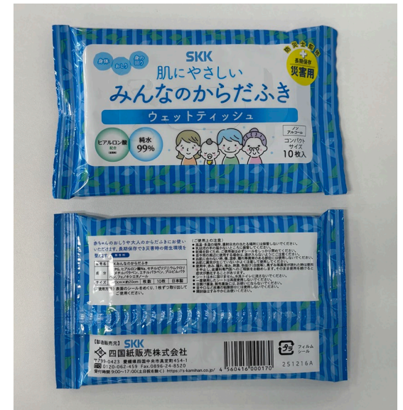
1箱あたり100パック入り / 1パックあたり10枚入り