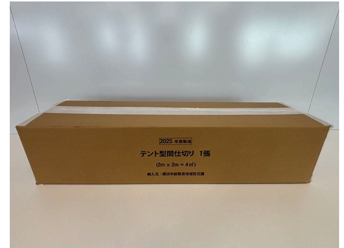
梱包サイズ: 750×210×180mm程度 / 重量: 約5.0kg

また、避難生活スペースとして活用する以外にも、更衣室、授乳スペース、洗濯物干し場やキッズスペースなど、個別の空間を作る際にも活用できます。