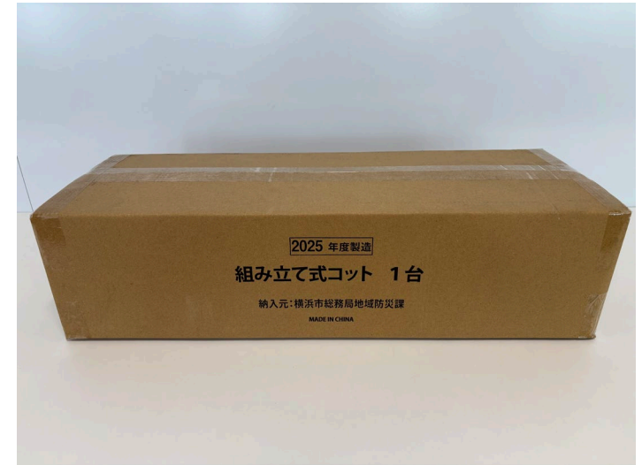
梱包サイズ:560×200×140mm程度 / 重量:約3.5kg

さらに簡易ベッドが不足する場合は、区災害対策本部に必要数量を要望することで、国等からの支援物資を地域防災拠点に供給します。