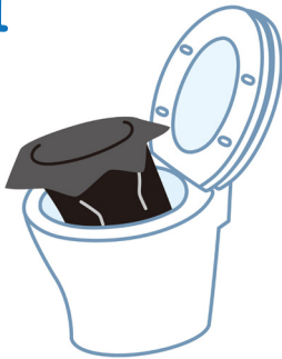
洋式便器に黒い袋をかぶせる