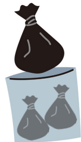
黒い袋は縛って燃やすごみに出す

※黒い袋は空気を抜いて、口をしぼり、トイレパックだけを大きな袋に入れてまとめます。