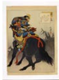
「英雄三十六歌撰 畠山重忠」（馬の博物館所蔵）

◀令和4年に放送開始予定のNHK大河ドラマ「鎌倉殿の13人」では畠山重忠公が登場