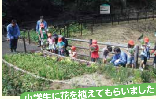
小学生に花を植えてもらいました