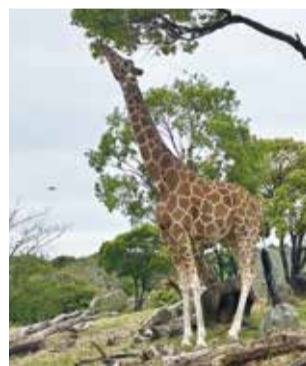
▲葉っぱを食べようとするキリン

毎年6月の「世界キリンの日」には、キリンに関するイベントを開催予定ですので、お見逃しなく!