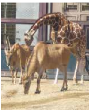
▲エランドの匂いを嗅ぐキリン