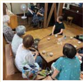
▲シニア向けの交流カフェ