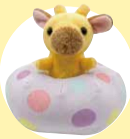
ちよころんキリン