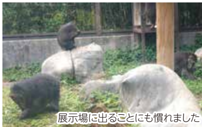
展示場に出ることも慣れました