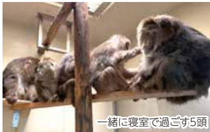
一緒に寝室で過ごす5頭

ズーラシアには日本モンキーセンターから、3月にサムとカルト、4月にザルバとアルカが来園し、現在は先に暮らしていたミートと一緒に5頭で生活しています。