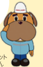
横浜市消防局マスコットキャラクターハマくん

めまい、頭痛、吐き気、体のだるさなどは熱中症のサインです。症状が出る前にしっかり対策をしましょう!