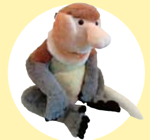
アニマルリウム テングザル