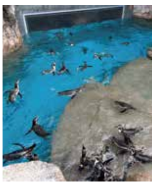
▲約50羽の群れが一斉に餌を食べる様子は迫力満点です