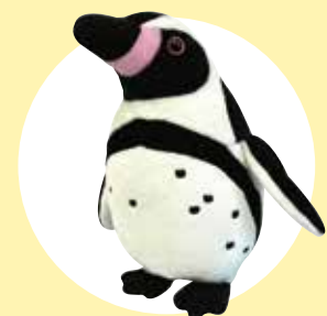
ペンギンコレクション ファンボルトペンギン