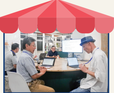
「働く」がキーワードの実験拠点 「トリオ左近山」

自治会町内会以外にも、自分のやりたいことを実現しながら、地域のつながりを作る活動があります!