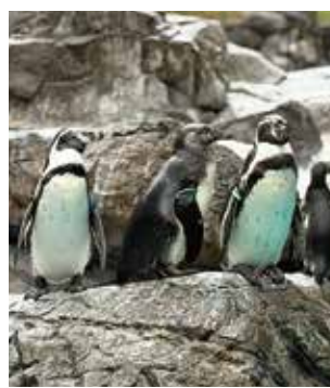
▲野生での暮らしが想像できる、自然の岩場を模した展示場

日本では飼育している動物園や水族館が多いことから、身近に感じられるファンボルトペンギンですが、野生ではエサとなる魚の乱獲などにより、個体数が大幅に減少しています。ズーラシアでの姿を見ながら、ぜひ野生での暮らしにも思いをはせてください。