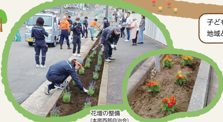
花壇の整備 (本宿西部自治会)

子どもを通じて地域の方と関わる機会が増え、地域とのつながりが広がったと感じています。