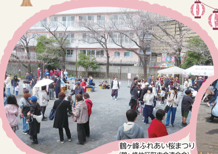
鶴ヶ峰ふれあい桜まつり (鶴ヶ峰地区町内会連合会)

自治会ではさまざまな考え方が集まります。大変なこともありますが、皆が地域を良くしたい同じ思いで、無理なく楽しく活動しています。