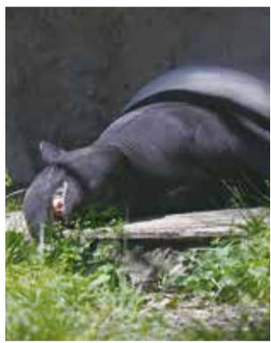
▲いつも気持ちよさそうに寝ています

4月27日の「世界バクの日」にあわせて、4月26日にはバクの生態や野生での現状についてお話しする特別ガイドを行います。ぜひズーラシアで暮らしているバクを見に来てください。寝顔もとてもかわいいです!