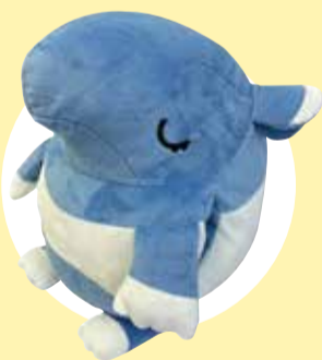
ハンドマフゆめばくら