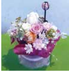
▲写真はイメージです

🕒2月21日(土)13時30分～14時30分👤18歳以上／先着12人📄¥2,000円📅1月17日9時20分から直接(☎翌日から)