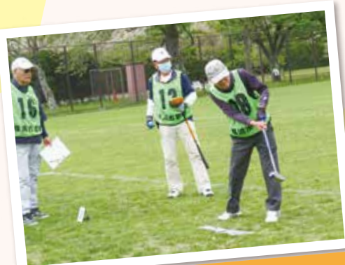
グラウンド・ゴルフ

「かがやきクラブ旭」(旭区老人クラブ連合会)の会員数は市内最大で、7,000人を超えています。 60歳代から90歳代までの幅広い年代の人たちが、地域で楽しく、生き生きと活動・活躍をしています。