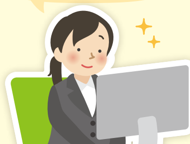
ジョブスポット旭のナビゲーター