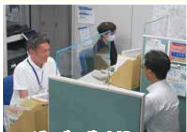
ジョブスポット旭での 相談の様子