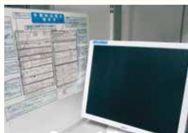
パソコンを使って 仕事探しができます