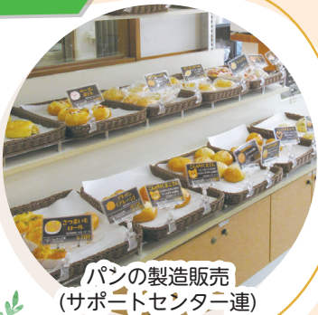
パンの製造販売 (サポートセンター連)

「サポートセンター連」 で、パンの販売やカフェで の接客・清掃、ビーズアク セサリー作りなどをして います。