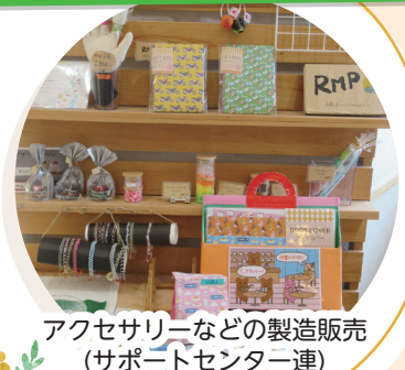
アクセサリーなどの製造販売 (サポートセンター連)

いつも買いに来てくれる お客さんがいることや、 自分で作ったものが商品 になることです。 コツコツと取り組む仕事 が好きです。