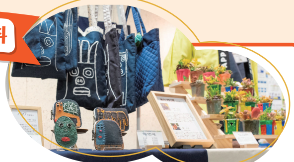
▲昨年度の「あっぱれフェスタ」(マルシェ)の様子

あっぱれオンステージ(バンド演奏・演劇 など)、マルシェ(カフェ・焼き菓子・布製品・ アクセサリーなど)、アート展示ほか