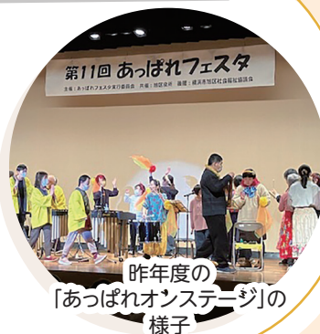
昨年度の 「あっぱれオンステージ」の 様子

「あっぱれフェスタ」には創作劇の グループ「劇団れん」のメンバーとし て参加しています。 何か面白そうだな、と思ってやっ てみたら、思ったことができてうれし かったので続けています。