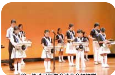
鶴ヶ峰地区町内会連合会鼓笛隊