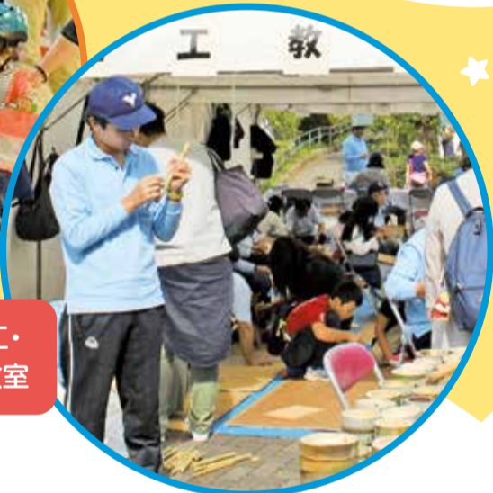
竹細工・工芸教室