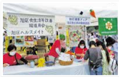
▲昨年開催時の様子