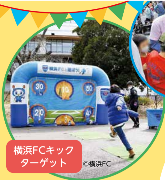
横浜FCキックターゲット