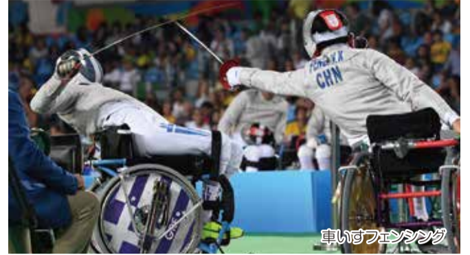
車いすフェンシング