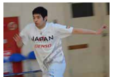
▲練習でも試合を想定して激しくぶつかり合います。(日本代表合宿にて=2019年12月)