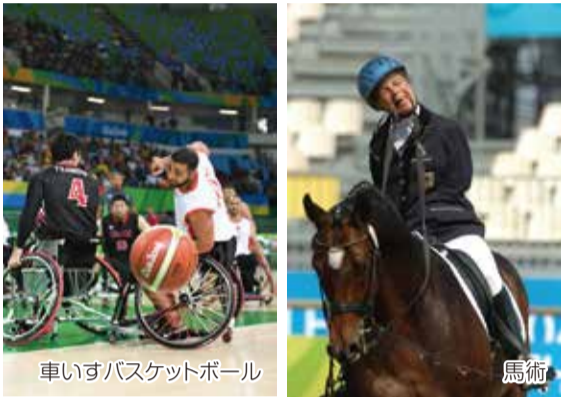
車いすバスケットボール