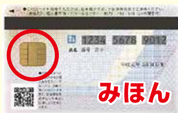
▲マイナンバーカード裏面

この「電子証明書」の有効期限は、発行の日から5回目の誕生日か、マイナンバーカードの有効期限のいずれか早い方となります。