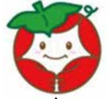
旭区の認知症に関する取り組みのシンボルマーク「ほっどちゃん」

徘徊が心配な人は、名前や連絡先などの情報を事前に登録することができますので、近くの地域ケアプラザまたは区役所にご相談ください。登録用紙はホームページからもダウンロードできます。写真をご持参ください。