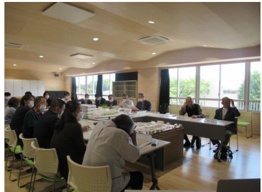
建設懇談会の様子