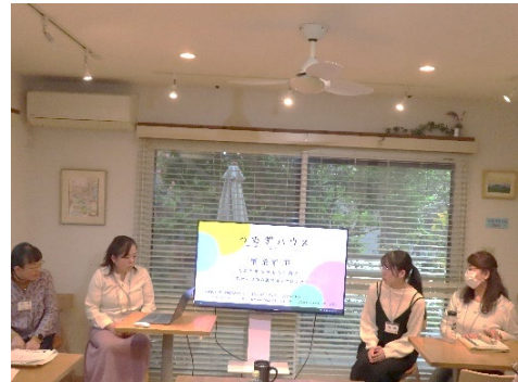
(チーム発表②) つむぎハウス 若者と地域がともに紡ぐこれからの街の居場所プロジェクト