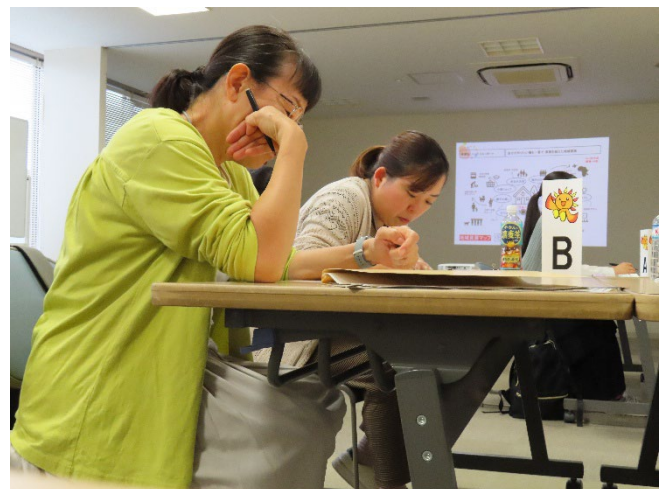
真剣にマップを作成中。