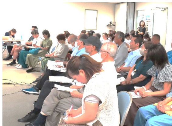
メモを取りながら真剣に講師の話を受講生