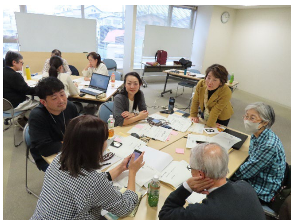
メンバーそれぞれのプランをまとめるために、講師のアドバイスを聞きながら進めました。