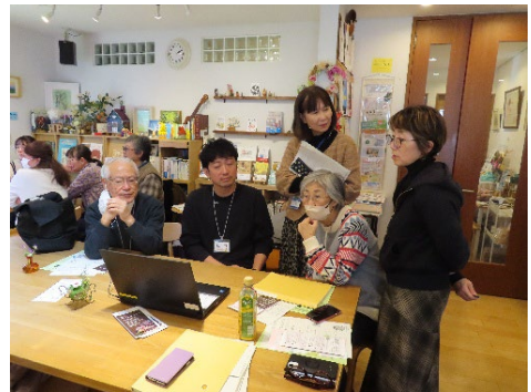
グループプラン発表前の最終準備！