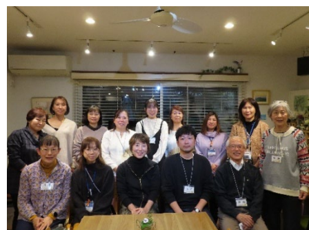
講師を囲んでの記念写真