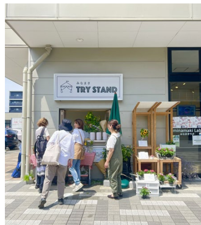
やってみたいを実現できる『みなまき TRY STAND』は、日替わり店主の小商いスペースです。