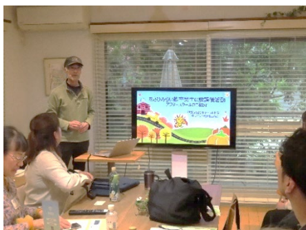
あさひみらい塾アフタースクールの紹介 横の繋がりを大切にしています！