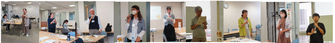
連続講座受講生 9 名の自己紹介 私のやりたい活動を伝え、このメンバーで講座が始まります。