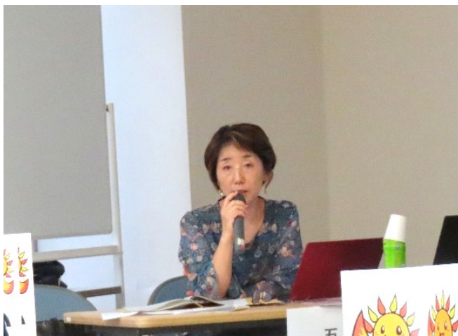
講師のロードマップを参考にやりたいことを言語化することの大切さを学んでいます。