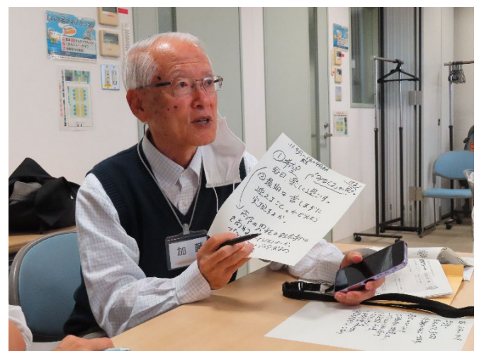
各グループでそれぞれのマップを発表 その後、質問に答えます。