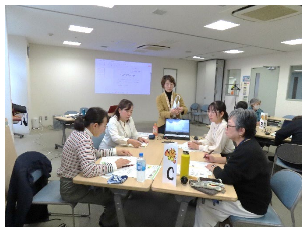
ひとりひとりの思いを言葉にすることで段々プランとして形になっていきました。