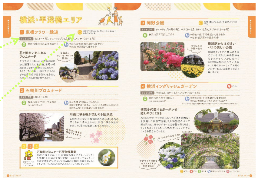
▲エリアごとのスポット紹介ページ例

● お子さまとのお出かけにおすすめのスポットには、歩行者専用道路や遊具の情報などおすすめのポイントも掲載しています。