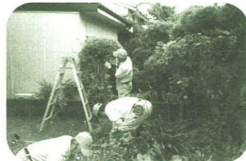
住民同士のちょっとした助けあい