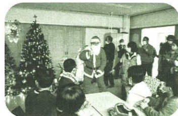
地域交流イベントの開催

社会福祉協議会では、共に支えられ生きていく 地域共生社会を実現するために、 賛助会費へのご協力をお願いしています。 みなさまのあたたかいご支援をよろしく申し上げます！