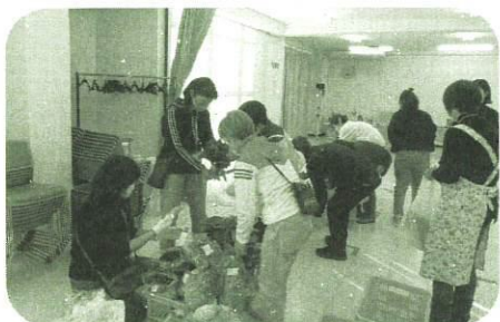
ひとり親家庭等向け旭区産野菜無料頒布会