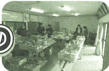
生活にお困りの方への食料品等の無料頒布会