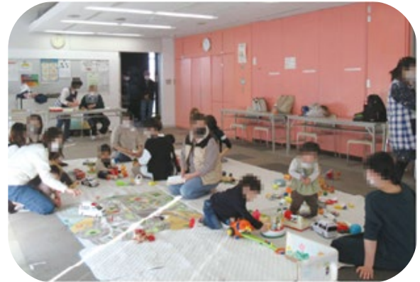
地域の親子の居場所「子育てサロン」