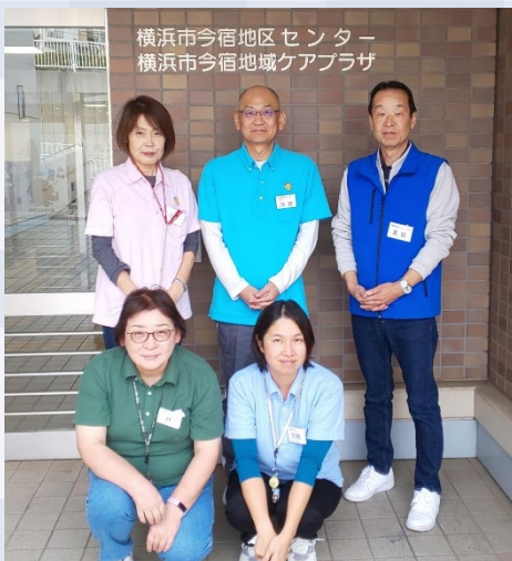
横浜市今宿地区センター 横浜市今宿地域ケアプラザ

2001年7月22日に開館して22年経ちますが、旭区内の地区センターでは比較的新しい地区センターになります。閑静な住宅地の中にあり地域の皆さまの「憩いの場」として親しまれています。