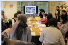
第2講 ハートフル・ポート