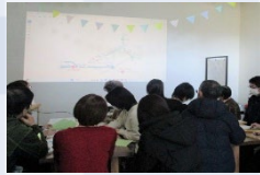
第4講 みなまきラボ