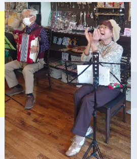
横浜西 アコーディオン 愛好会 「音楽会」 @第2まどか

「みなくる」には、特技を活かした活動で多くの方がアドバイザー登録しています。「登録したい」「来てほしい」など「みなくる」までお問い合わせください。