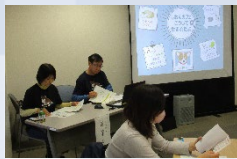
第3講 しおんカフェ