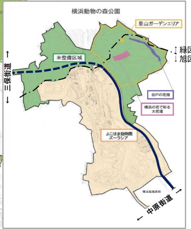
横浜動物の森公園未整備区域