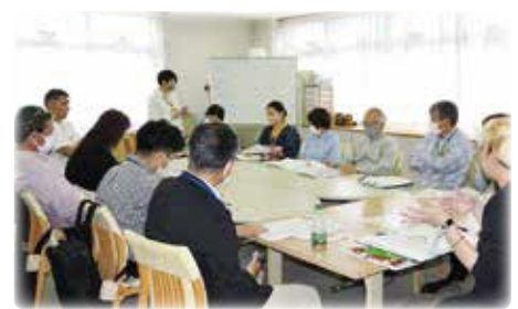
まちぐるみ福祉推進会議の様子

災害時支援の取組を検討するなかで、日常の見守りの大切さに改めて気づき、地域全体に見守りを広げるための取組を進めています。