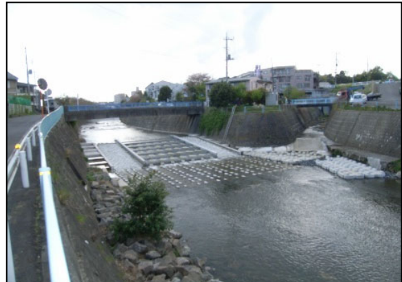
中堀川合流点の状況