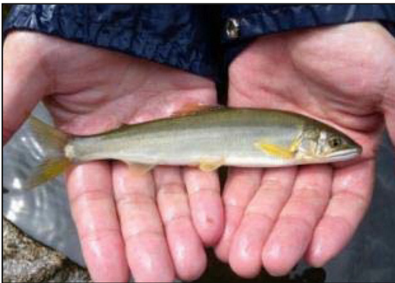
帷子川で確認されたアユ

また、帷子川は「アユが遡上する街、ヨコハマ」のモデル河川として、魚道整備や生息環境の改善などに取り組んできました。川底を掘り下げる際には、遡上するアユなどの生態系にも十分配慮して進めます。