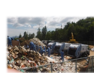
円滑かつ迅速な災害廃棄物の処理