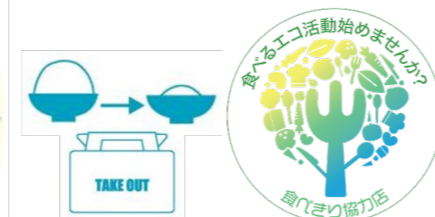
小盛りやテイクアウトの飲食店を認定する「食べきり協力店」の利用促進