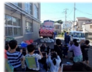
小学校向けの出前講座