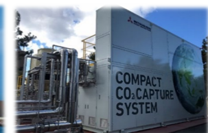
焼却工場のCO 2 回収(CCUの実証試験)