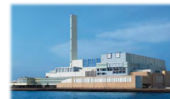
工場の新設・長寿命化工事