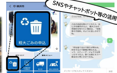
DXによる行政サービスの向上と効率化