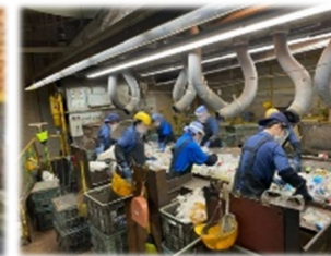
リサイクルのために缶・びん・ペットボトルを選別