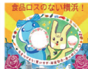
ポスターコンクール