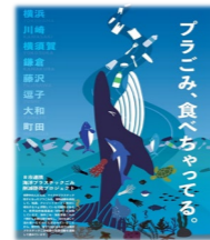
近隣市と連携した広域でのプラスチック海洋流出対策