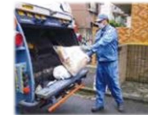
日々の家庭ごみ収集