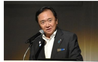
神奈川県知事 黒岩 祐治