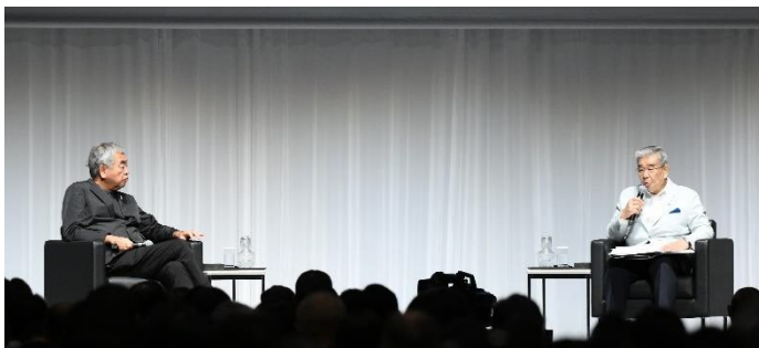
隈 マスターアーキテクト × 涌井 チェアパーソン