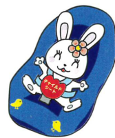
チャイルドシート着用推進 シンボルマーク「カチャビヨン」