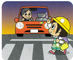
歩行者を優先しよう! 早めにライトを点灯しよう!