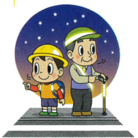
左右を確認しよう!