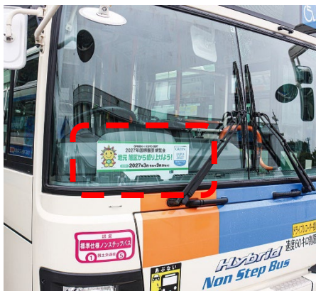
<掲示イメージ>運転席の前方

協議会の会員である相鉄バス株式会社のご協力により、旭区内を走行する相鉄バスの車内に、GREEN×EXPO 2027 をPRするプレートを表示させていただくことになりました。