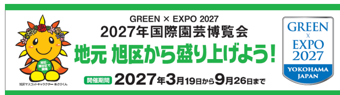
<掲示するプレート>