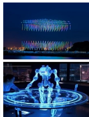
最先端技術イメージ