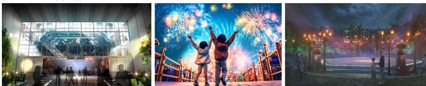
特徴あるテーマパークのエリアイメージ

テーマパークゾーンは、「最先端のエンターテインメントが集まるエリア」、「子供から大人まで楽しめるエリア」、「スリルあふれるエリア」など、特徴のある複数のエリアにゾーニングし、世代を問わず多くの人々が世界観に没入できる空間を創ります。