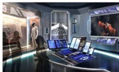
テーマパークゾーンのイメージ