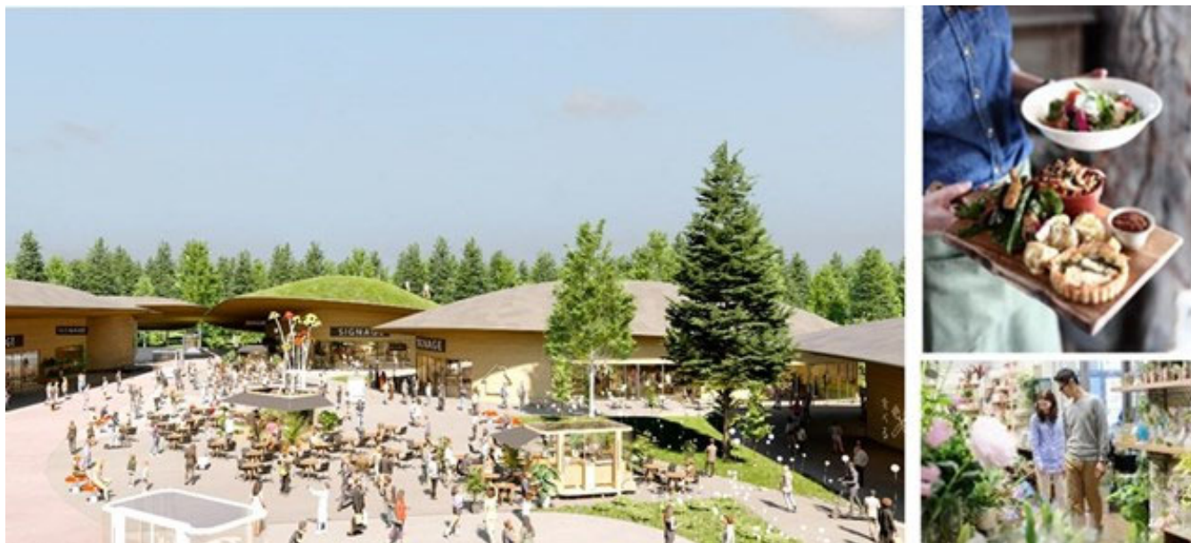
(左)公園隣接ゾーンイメージパース、(右)商業店舗イメージ

都市公園との結節点であることや、GREEN×EXPO 2027 会場跡地であることに鑑み、「農と食」や「Well-being」など、自然・人・社会が調和する新しいライフスタイルを提案する、自然をコンセプトとした商業施設を導入します。