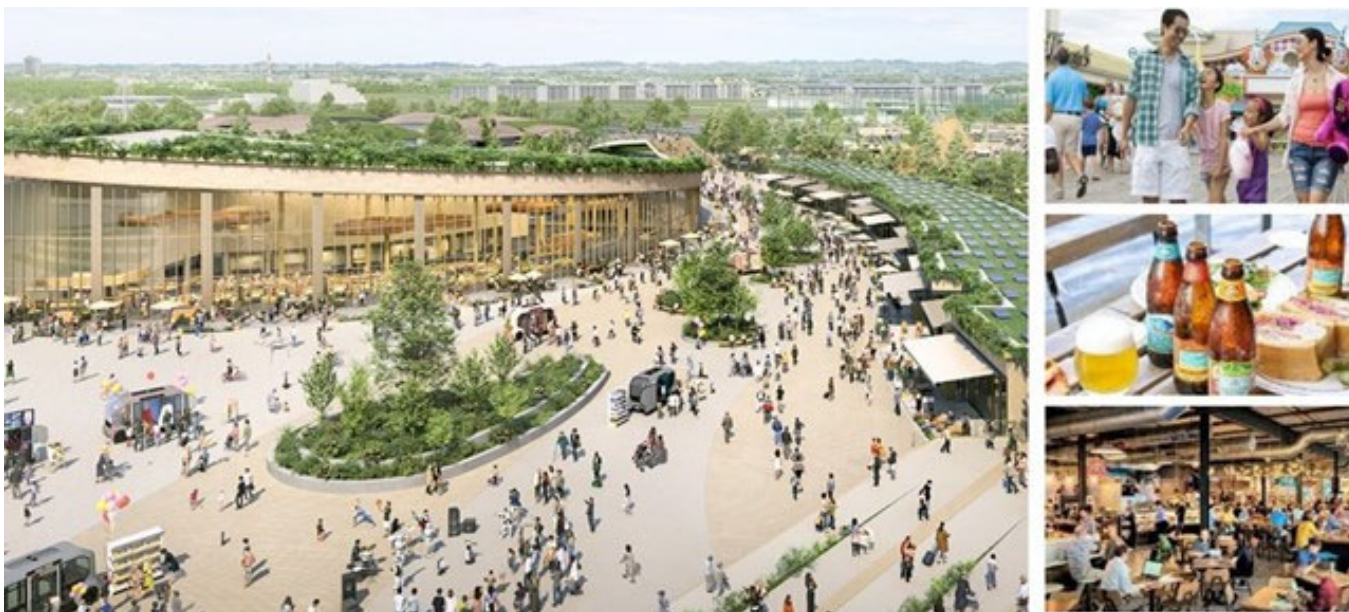
(左)駅前ゾーンイメージパース、(右)商業店舗イメージ

テーマパークのグッズショップやコンビニ、ドラッグストアなど、テーマパーク来場者の利便性向上に寄与するテナントを誘致するとともに、カフェ、レストラン等、市民や地域の方々が、日常的に利用できるバラエティ豊かな店舗を集積させた商業施設を設けることにより、更なる賑わいづくりを行います。