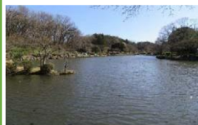
別名「大池公園」の大池