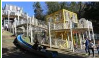
ダイナミックな「とりでの森」

施設の老朽化への対応や、動物とのふれあい事業を含めた施設のあり方について検討が必要です。