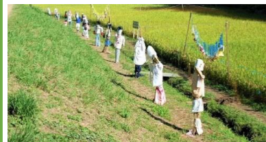
教育水田の里山風景