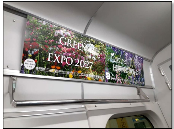
相鉄線 車内の窓上ポスター