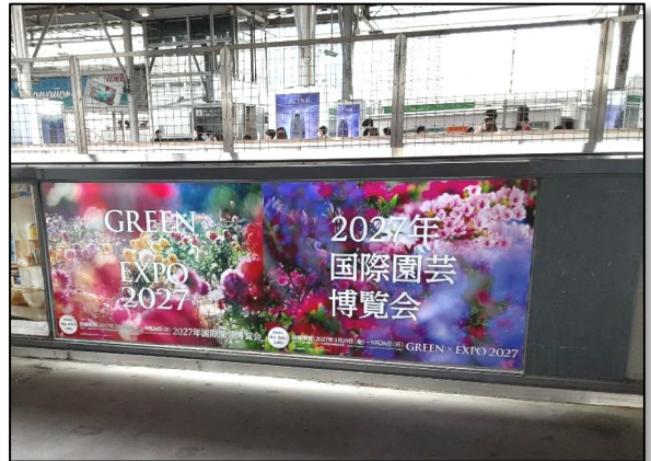
東急田園都市線 二子玉川駅