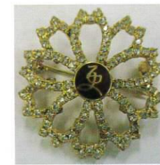
徽章 更生保護女性会