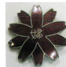
徽章 更女保護婦人会