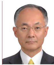
辻 琢也 氏 一橋大学大学院法学研究科教授

同志社大学文学部卒業後、CBCテレビにアナウンサーとして入社。バラエティ番組から報道番組まで幅広く担当する。「ゴソマ〜GOGO!Smile!〜」(CBCテレビ制作、月〜金13:55-)の番組開始時からMCを務める。2020年3月にCBCを退社しフリーアナウンサーへ転身。2019年の週刊文春の好きなアナウンサーランキングでは、在京キー局の有名アナに混じって異例の5位、2021年のJ-CASTニュースの好きなワイドショーのMCでは1位を獲得。著書「ゴソマ石井のなぜか得する話し方」(ダイヤモンド社)などがある。