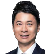
石井 亮次 氏 フリーアナウンサー

早稲田大学商学部卒業、名古屋市議員(平成7年4月当選後、7期連続当選)、名古屋市議員、指定都市議事会会長、衆議院議員初当選(第49回総選挙)、自由民主党法務・自治関係団体委員会副委員長、自由民主党財政・金融・証券関係団体委員会副委員長、自由民主党地方組織・議員総局次長を経て、令和4年8月総務大臣政務官(第2次岸田改造内閣)