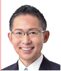
中川 貴元 氏 総務大臣政務官

早稲田大学商学部卒業、名古屋市議員(平成7年4月当選後、7期連続当選)、名古屋市議員、指定都市議事会会長、衆議院議員初当選(第49回総選挙)、自由民主党法務・自治関係団体委員会副委員長、自由民主党財政・金融・証券関係団体委員会副委員長、自由民主党地方組織・議員総局次長を経て、令和4年8月総務大臣政務官(第2次岸田改造内閣)